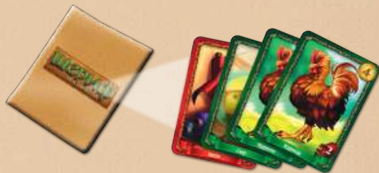
Товары в мешке