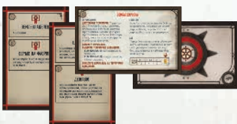
9 карт Автомы